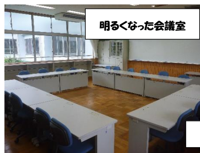
明るくなった会議室