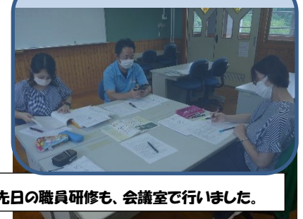
先日の職員研修も、会議室で行いました。