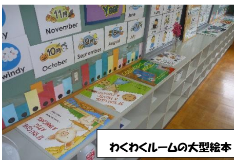
わくわくルームの大型絵本

夏休み中、特別教室の環境を整えました。わくわくルーム(外国語室)に大型英語絵本を展示し、子どもたちがいつでも読めるようにしました。使わなくなっていたメディアルームは会議室にリニューアルしました。今後はPTAの活動なども、ここで快適に行うことができます。ぜひ、ご活用を！！